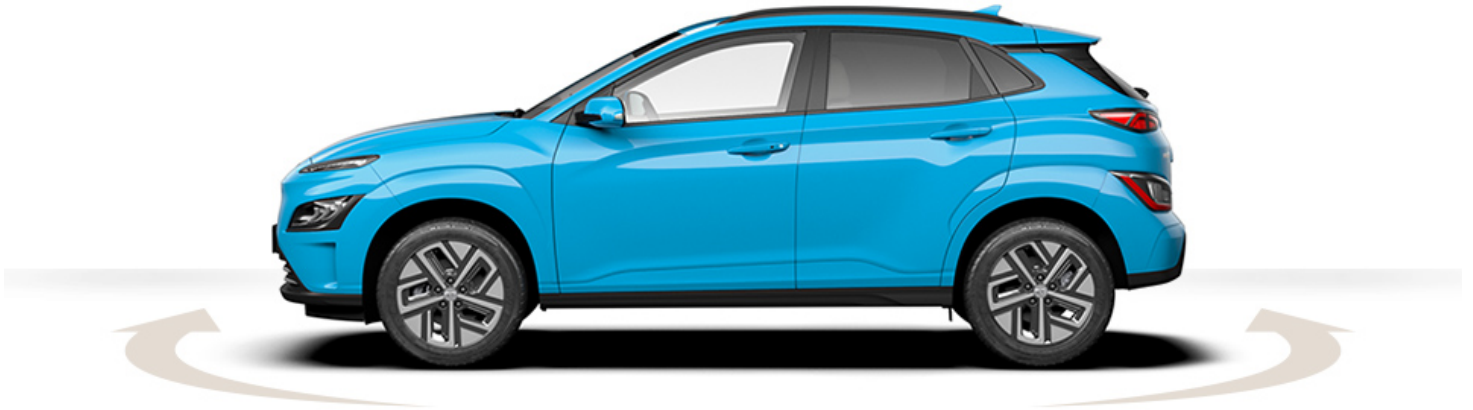
Abbildung ist als unverbindlich zu betrachten. Fahrzeugabbildungen enthalten z. T. aufpreispflichtige Sonderausstattungen.