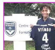
Merdi à Bordeaux