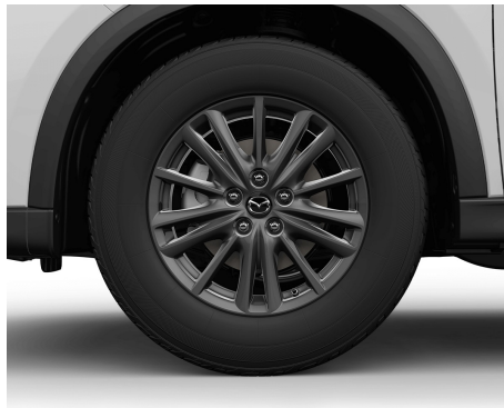
17 LEICHTMETALLFELGEN DUNKELGRAU MIT 225/65 R17 BEREIFUNG