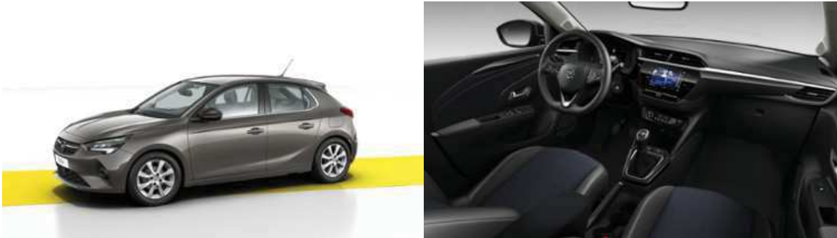
Corsa Elegance 1.2, 55 kW (75 PS), Start/Stop, Euro 6d (Manuelles 5-Gang Getriebe) Mondstein Grau (Metallic), Stoff Imagination, Dunkelblau/Premium-Lederoptik, Schwarz