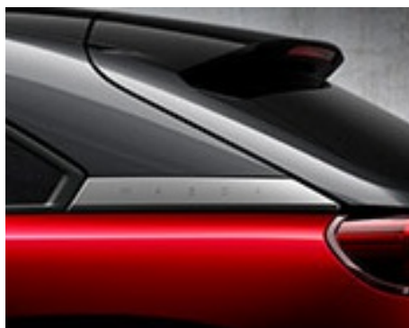
3-TON MAGMAROT METALLIC