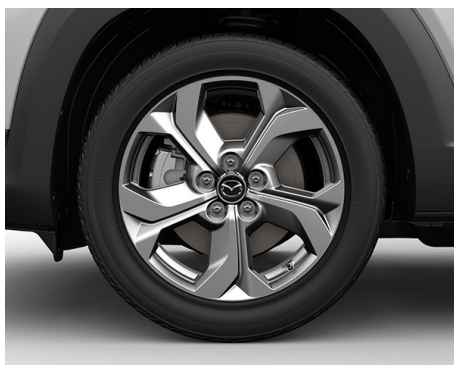
18-ZOLL-LEICHTMETALLFELGEN IN SILBERGRAU MIT HOCHGLANZFINISH UND 215/55 R18 BEREIFUNG