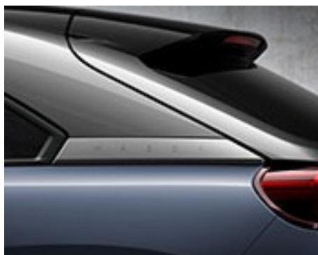
3-TON POLYMETAL GRAU METALLIC